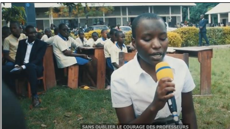
Le remerciement d'une élève (vidéo 2:37, avec trad. du kirundi)

Voici les images de la fête de remise des certificats http://www.youtube.com/watch?v=Yuz8gRvE--Y