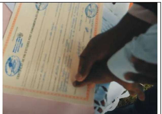
Un élève signe son diplôme par son empreinte

Le compte de l'ASBL Menya Media International est BE25 7340 3064 9682 Code BIC kredbebb et mettez en communication, «action Donne à voir». Le site est http://donnavoir.org/